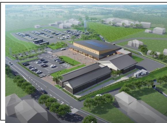
道の駅おがわまち 完成予想図